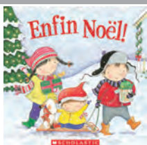
ENFIN NOËL Maryann Cocca-Leffler