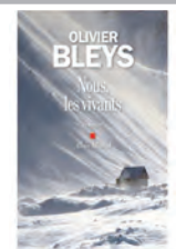
NOUS LES VIVANTS Olivier Bleys