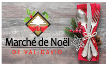
Marché de Noël DE VAL-DAVID