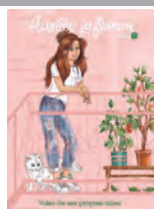
LE JOURNAL D'AURÉLIE LAFLAMME Voler de ses propres ailes - India Desjardins