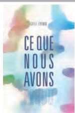
CE QUE NOUS AVONS PERDU Boucar Diouf